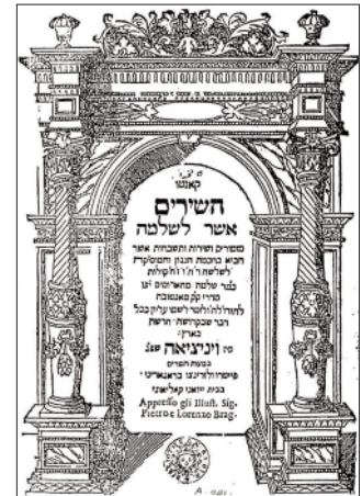
Uit het boek: Hashirim asher leSholomo – Het lied van Salomo, van Rossi (± 1622)

De joodse componist Salomone Rossi (ca. 1570-1630) werkte aan het hof van de kunstminnende Gonzaga, hertog van Mantua. Net als in andere gebieden in Italië, dwong rond 1612 ook Gonzaga de joden in een getto te leven. Zijn waardering voor het veelzijdige werk van Rossi was echter zo groot, dat deze van het dragen van de jodenster werd uitgezonderd.