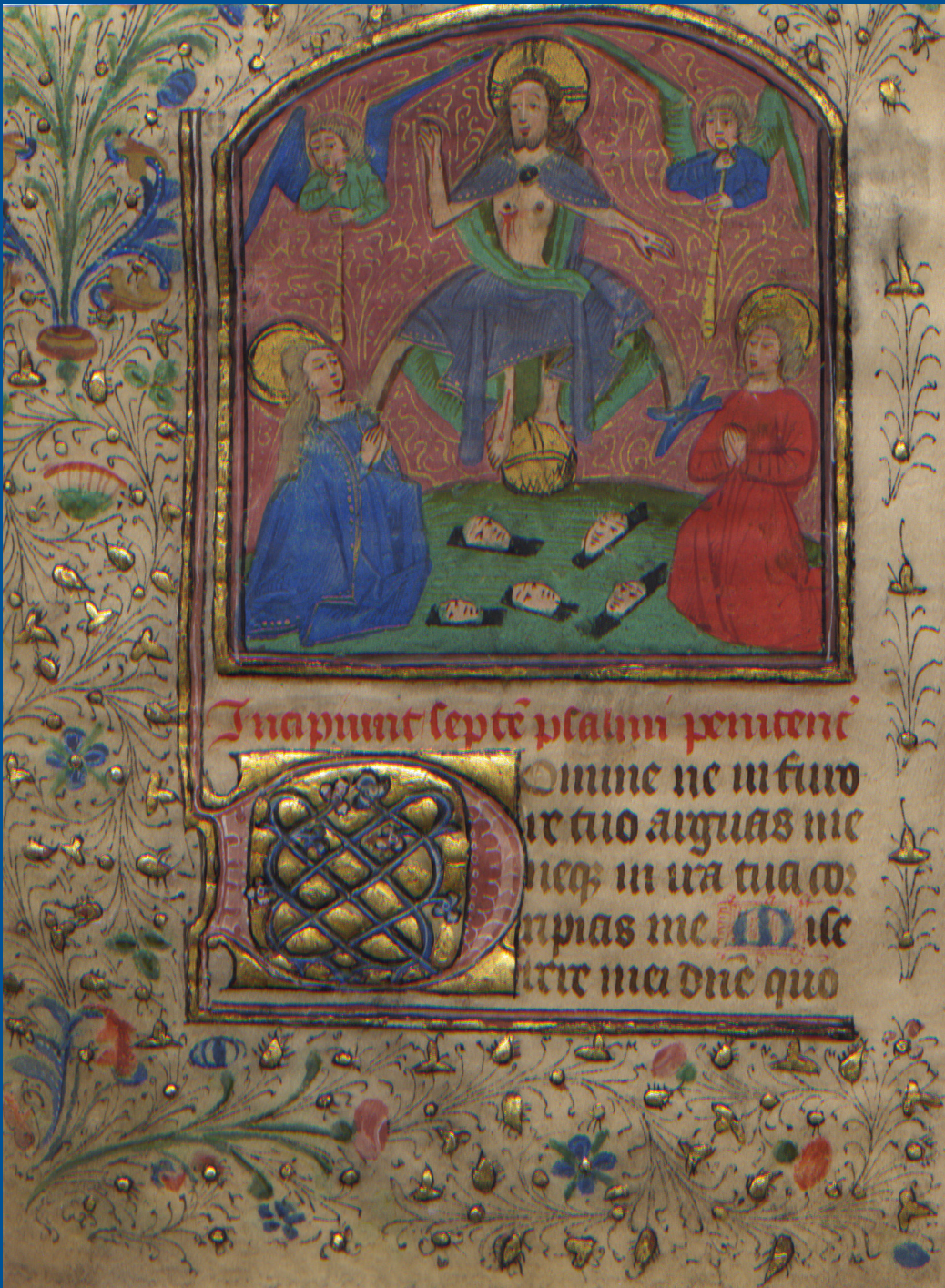
Miniatuur uit een 15 e -eeuws Frans Geijdenboek, bij Psalm 6