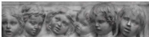
Detail van de Cantoria Luca della Robbia (15e eeuw, Florence)