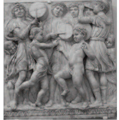
Detail van de Cantoria Luca della Robbia (15e eeuw, Florence)

SALAMONE ROSSI HEBREO Psalm 128: 'Shir hamma'alót'. 'Ashrei kol yere 'adonai'