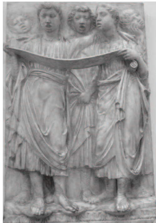
Detail van de Cantoria Luca della Robbia (15e eeuw, Florence)